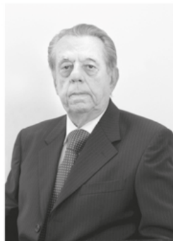
Ayrton Guedes Alcoforado Presidente: outubro de 1993 a janeiro de 1995 Engenheiro Civil - Natural de Olinda - PE ★1934