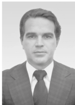
Mauro Fernando de Barros Correa Presidente: junho de 1986 a maio de 1987 Economista - Natural de Recife - PE ★1947