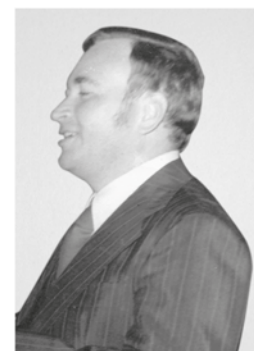
Manfredo José de Moraes Presidente: novembro de 1977 a maio de 1979 Engenheiro Civil - Natural de Recife - PE ★1935 †1999