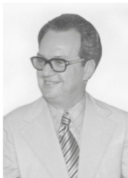
Marcionilo de Barros Lins Presidente: dezembro de 1992 a fevereiro de 1993 Médico - Natural de Escada - PE ★1919 †2003